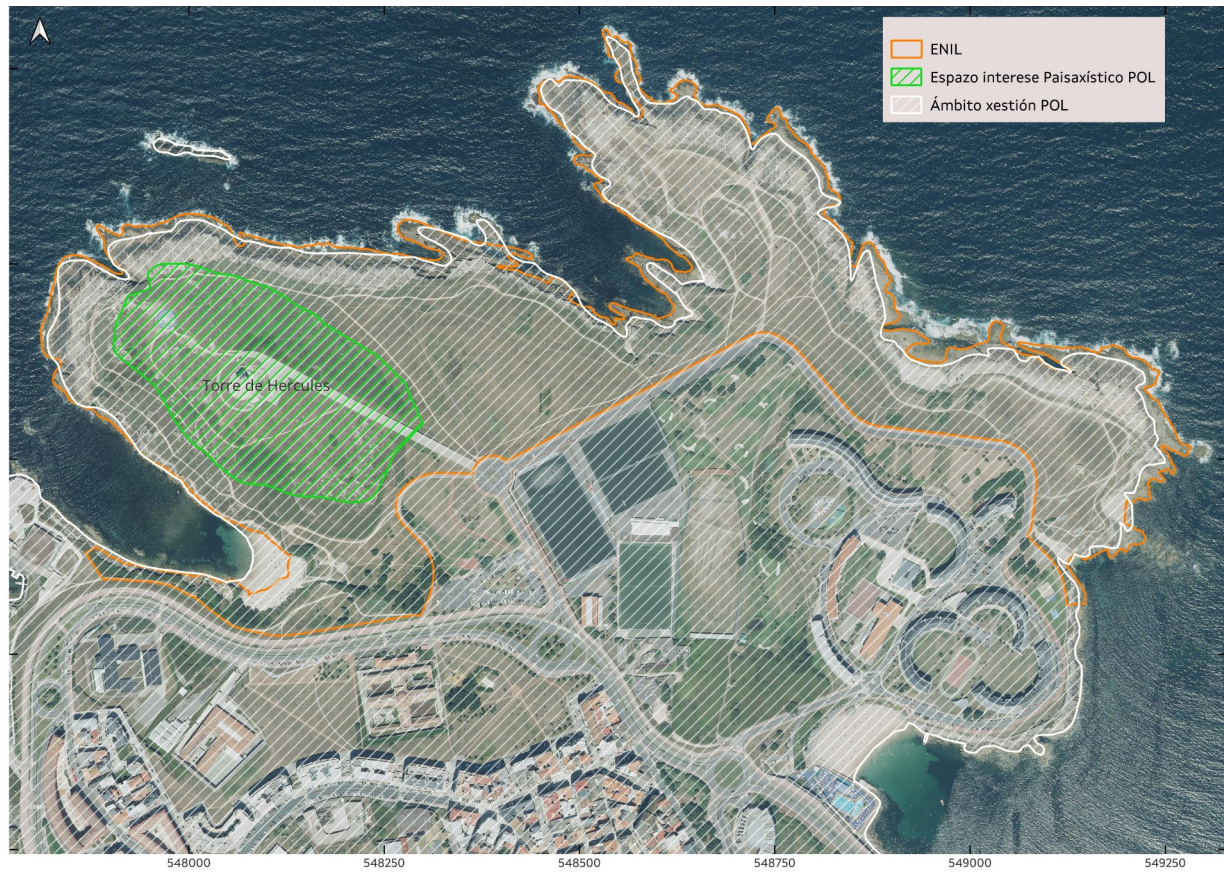
Mapa 4. Influencia do Plan de Ordenación do Litoral sobre o espazo protexido. A contorna máis inmediata á Torre de Hércules recóllese como Espazo de interese paisaxístico.