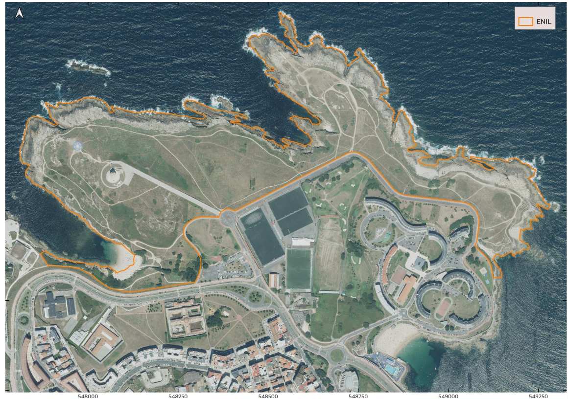
Mapa 1: Límites do ENIL Torre de Hércules.