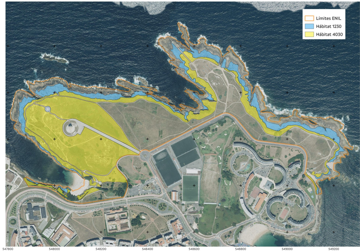
Mapa 3: Superficie ocupada polos hábitats 1230 (Cantís con vexetación das costas atlánticas e bálticas) e 4030 (Breixeiras secas europeas) dentro do ENIL.