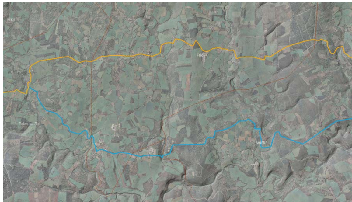
Superposición do trazado do Camiño e dos trazados con vestixios históricos ao trazado posto a exposición pública pola Xunta de Galicia no ano 1997