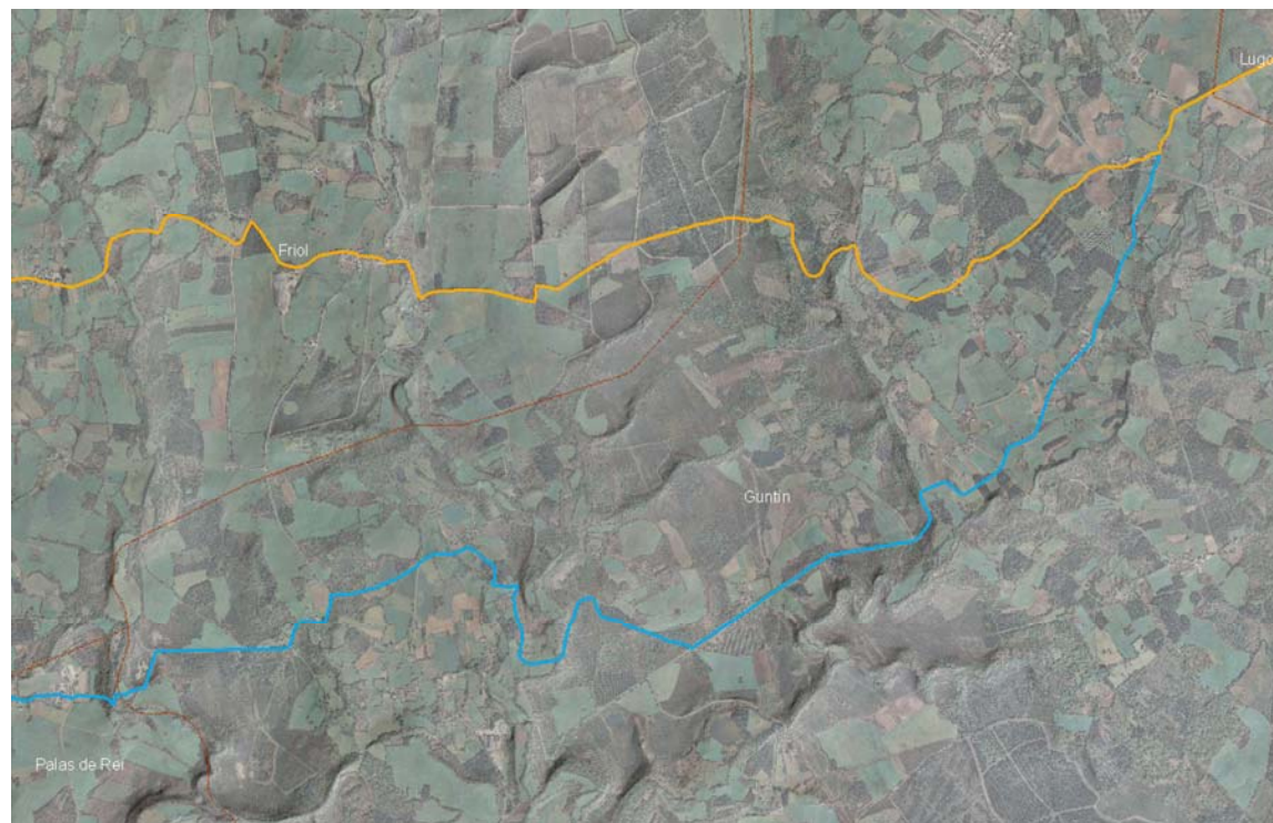
Superposición do trazado do Camiño e dos trazados con vestixios históricos ao trazado posto a exposición pública pola Xunta de Galicia no ano 1997

Trazado do Camiño — Trazado con vestixios históricos — Trazado Xunta de Galicia exposición pública 1997 —