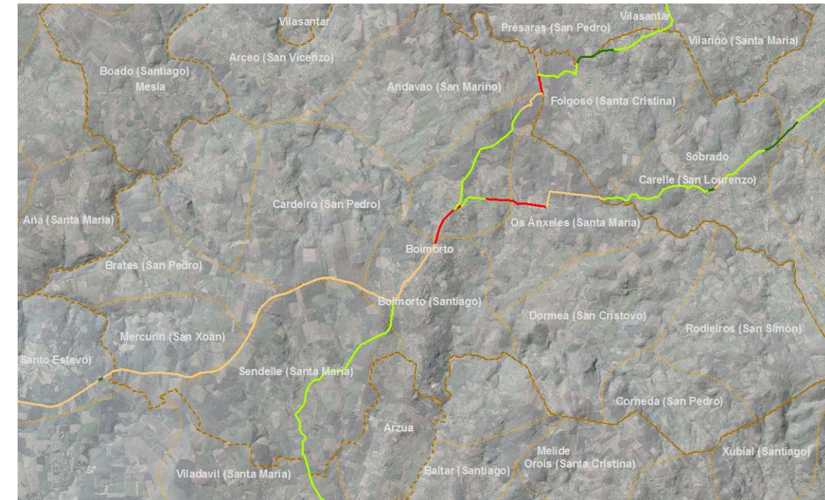
Valoración da calidade ambiental do Camiño no Concello de Boimorto

No seguinte plano representase mediante un código de cores a avaliación da calidade ambiental de cada un dos tramos do Camiño. Os factores que se tiveron en conta para a realización de dita avaliación foron: a calidade da paisaxe inmediato ao Camiño; a percepción que dende el se ten da paisaxe afastada e o seu nivel de calidade; o arborado e a vexetación vinculada ao Camiño; a calidade das edificacións do seu entorno; o grado de conservación da configuración tradicional da traza e por último a existencia de elementos ou circunstancias que poidan supoñer un impacto sobre o Camiño ou a súa contorna.