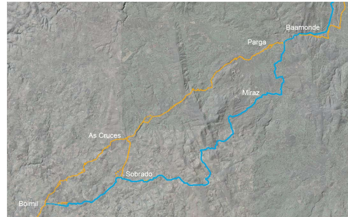
Variación do trazado do Camiño entre A Ponte de San Alberte e Boimil Trazado do Camiño — Trazado S. A. de Xestión do Plan Xacobeo — coincidente con trazado Xunta de Galicia 1997 mantido como trazado do camiño na proposta

Atendendo á consolidación do trazado que une A Ponte de San Alberte con Boimil, pasando por Sobrado, sinalizado pola Sociedade Anónima de Xestión do Plan Xacobeo e coincidente co que figura no expediente posto a exposición pública pola Xunta de Galicia no ano 1997, mantense igualmente como trazado do camiño. Este trazado pasa polas parroquias de San Breixo de Parga e Santa Locaia de Parga, no concello de Guitiriz; San Pelaxio de Seixón, Santiago de Miraz, San Pedro de Anafreita, San Mamede de Nodar e Santa María de Silvela, no concello de Friol; San Miguel de Codesoso, San Pedro da Porta e San Lourenzo de Carelle no concello de Sobrado e Santa María dos Ánxeles e San Miguel de Boimil, no de Boimorto.