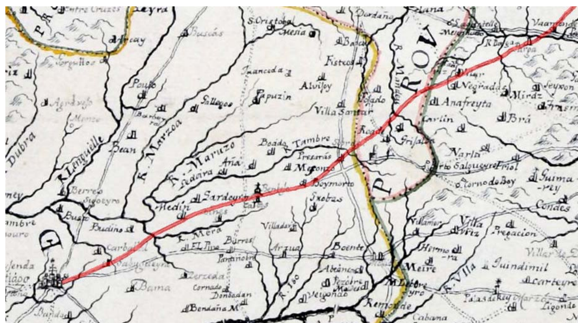
Mapa del Reino de Galicia de José Cornide (1762)

Neste plano o camiño que viña de Mondoñedo e Vilalba se cruza co camiño de Lugo a Betanzos a altura de Baamonde, tras cruzar o río Parga o trazado pasa por Parga, Présaras e Boimorto. Entre Boimorto e Santiago os puntos de paso e a localización das parroquias sinaladas son imprecisas. Ao leste de Boimorto aparece sinalando un santuario que probablemente se trate da ermida da Mota, ao lado do símbolo aparece o nome Benbejo, debaixo deste figura a referencia á parroquia de Calvos (San Martiño de Calvos de Sobrecamiño), a continuación aparecen os topónimos de Oines (actual Oíns), Medín, Carballal (Lamas de Carballal) e Sabugueira (San Paio de Sabugueira, A Lavacolla), sinalando mais que puntos de paso precisos o territorio polo que atravesa o camiño.