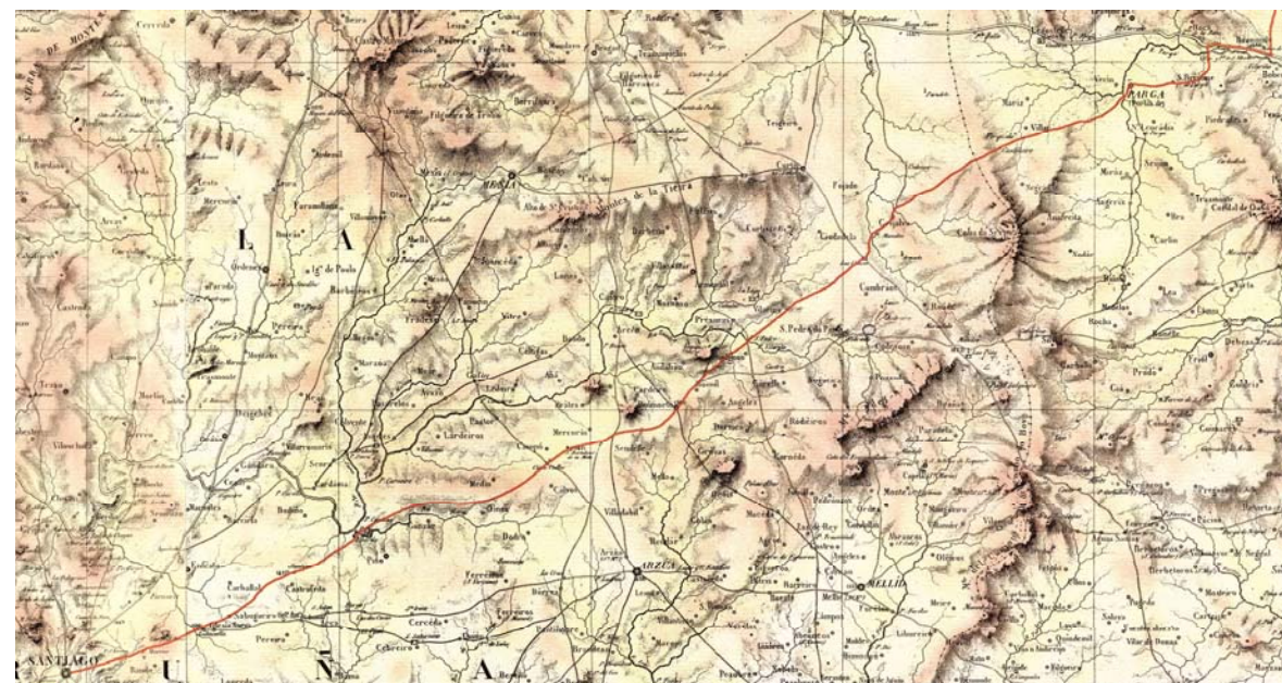
Carta Geométrica de Galicia de Domingo Fontán (1845)

Seguía por este camiño en dirección a Santiago pasando por Boimorto, San Bartomomé de la Mota e Las cinco Calles, xa no actual termo municipal de Arzúa.