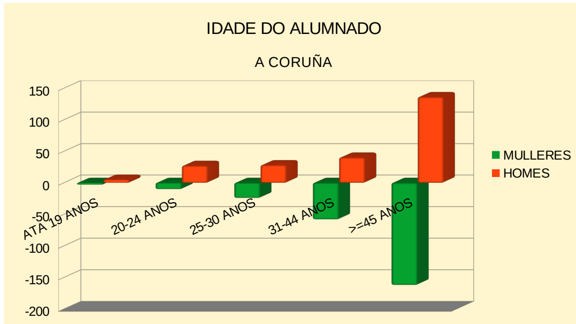
Gráfico barras IDADE Coruña