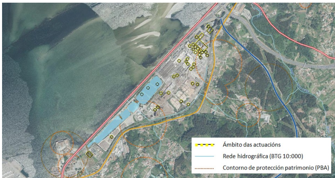
Principais afecções ambientais